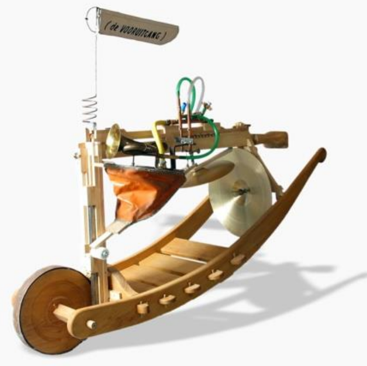
DE VOORUITGANG [Jaap Glandorff, 2011]

De gemeente Gennep is van oudsher een plek waar creatieve geesten zich op hun gemak voelen. Het is ook niet voor niets dat Gennep rijk is aan kunstenaars van zeer uiteenlopende aard. We zijn daar als gemeente trots op, immers: kunst zet mensen aan het denken, geeft nieuwe waarde en oriëntaties en stimuleert mensen in hun eigen creativiteit 0 . Kunstenaars zijn de cultuurmakers en zijn van groot belang in de cultuursector en brengen sprankelende en verrassende initiatieven voort.