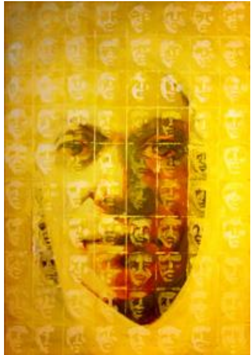
YELLOW MULTIPLICITY [Mirso, 2009]